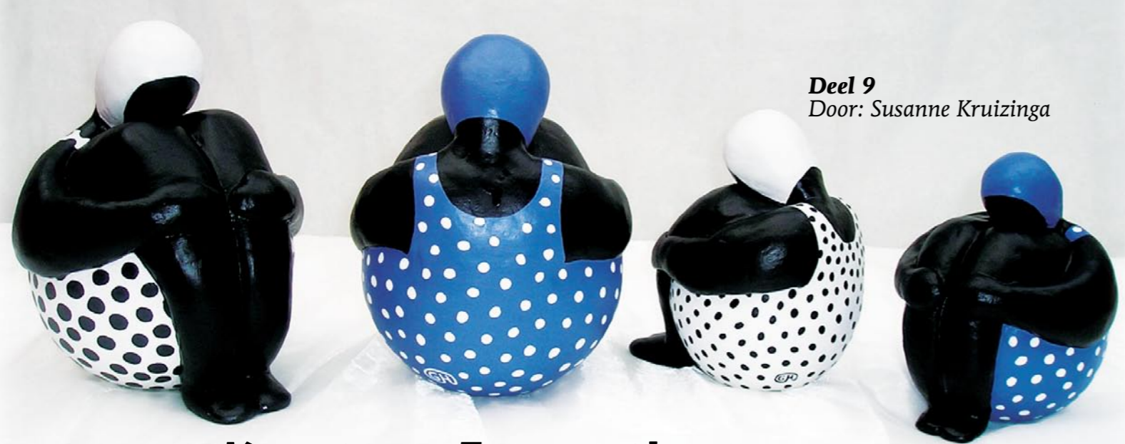
Deel 9 Door: Susanne Kruizinga